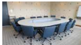
806 会議室：口の字形式 14 席〔39㎡〕