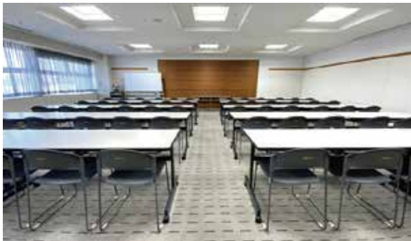
804 会議室：スクール形式 62 席〔103㎡〕