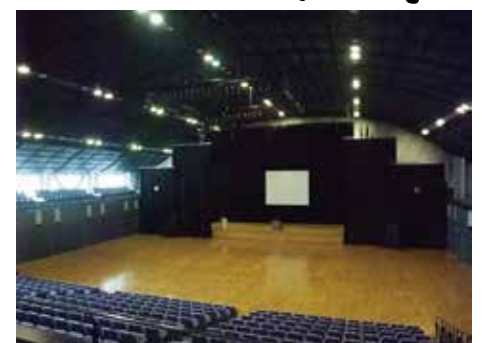
イベントホール（アリーナ棟 4F）