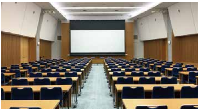
国際会議場：スクール形式 160 席〔355㎡〕