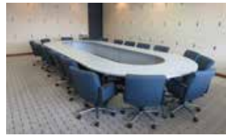
802 会議室：口の字形式 18 席〔44㎡〕