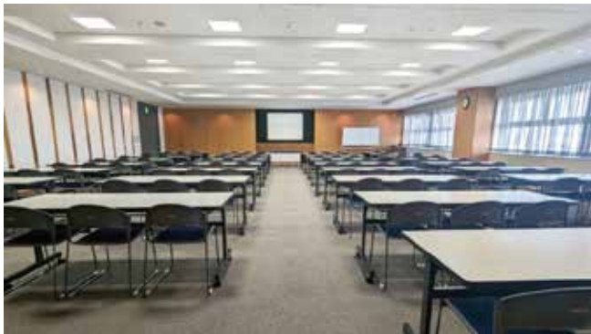
801 会議室：スクール形式 104 席〔189㎡〕