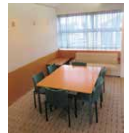
特別小会議室：6 席＋ソファー〔15㎡〕