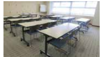
803 会議室：スクール形式 26 席〔55㎡〕