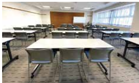
805 会議室：スクール形式 47 席〔82㎡〕