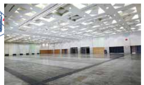
展示見本市会場（アリーナ棟 1F）