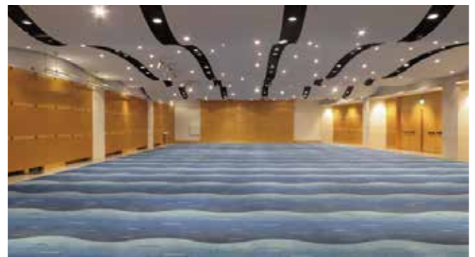
海峡ホール：シアター形式 300 席〔355㎡〕