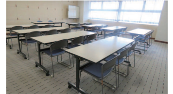
803 会議室：スクール形式 26 席〔55 m 2 〕