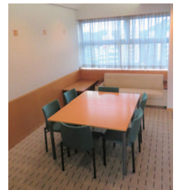
特別小会議室：6 席+ソファー〔15 m 2 〕