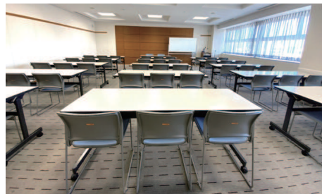
805 会議室：スクール形式 47 席〔82 m 2 〕