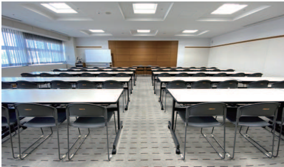
804 会議室：スクール形式 62 席〔103 m 2 〕