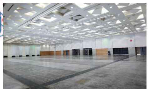
展示見本市会場(アリーナ棟 1F)