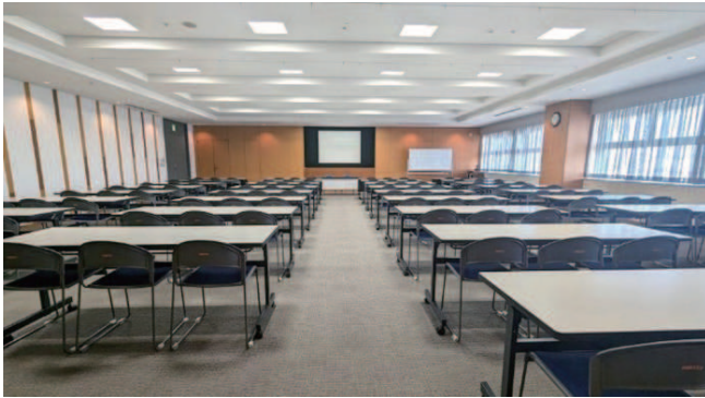
801 会議室：スクール形式 104 席〔189 m 2 〕