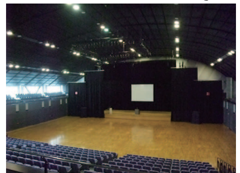
イベントホール(アリーナ棟 4F)