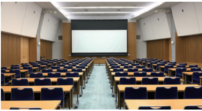
国際会議場：スクール形式 160 席〔355 m 2 〕