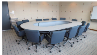
806 会議室：口の字形式 14 席〔39 m 2 〕