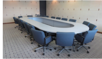
802 会議室：口の字形式 18 席〔44 m 2 〕