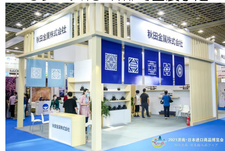
出店スペースのイメージ図