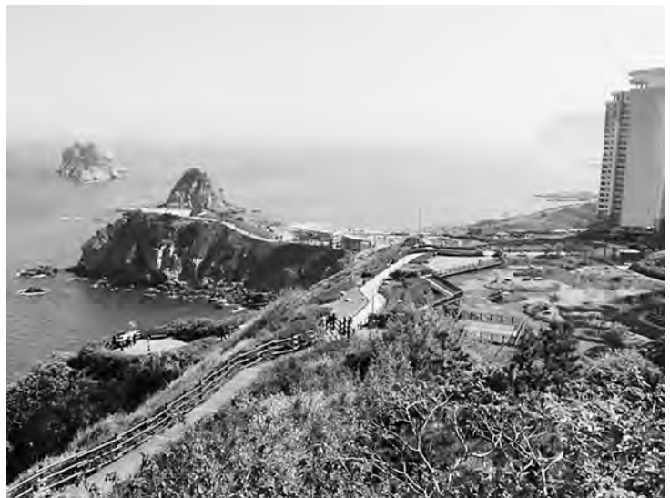
【五六島へと続くカルメッキル】