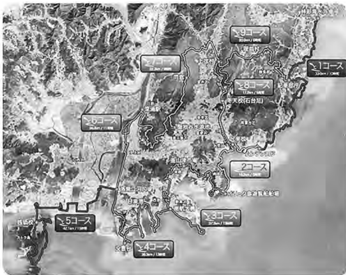
【釜山カルメッキル全コース】

釜山にお越しになった際には、買い物、観光、食べ歩きだけではなく、一度釜山カルメッキルをハイキングしてみてもいかがでしょうか？新たな釜山を発見できるかもしれません。市内主要観光案内所（海雲台、釜山駅、南浦洞など）では「カルメッキル」スタンプラリー用の冊子も配布されていますので、スタンプを集めて釜山観光記念にしてください！